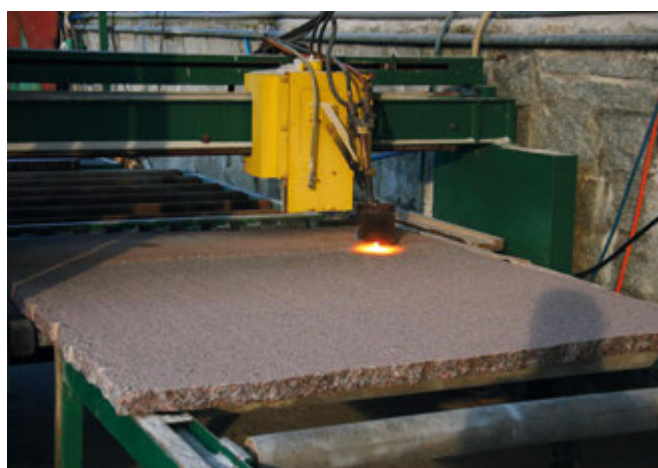
Automat do nadawania faktury płomieniowanej na płytach z kamienia naturalnego