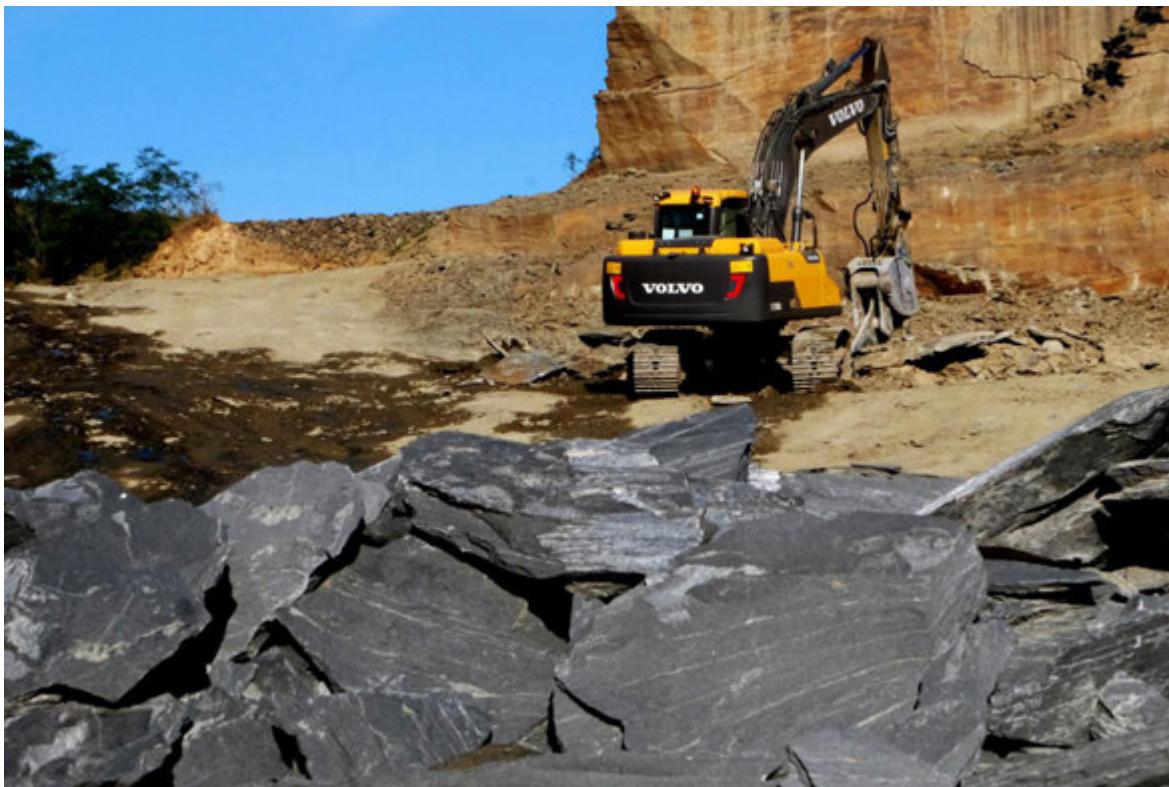
Fot. 4. Złoże łupków – Kopalnia Łupka Szarogłazowego w Jenkowie – Fot. 1 - 4

Oddzielność płytkowa kopaliny, która jest charakterystyczną jej cechą decyduje o sposobie jej wykorzystania do produkcji kamienia łupanego o różnych zastosowaniach. Powierzchnie oddzielności skośnie przebiegające w stosunku do warstwowania powodują, że posiadają zróżnicowaną barwę, połysk powierzchni złupkowania (foliacji) i szorstkość co decyduje o walorach dekoracyjnych i użytkowych kamienia łupanego. Barwa zmienia się od szarej z odcieniem oliwkowym, przez żółto-rdzawą i ciemnoszarą do prawie czarnej. Walor dekoracyjny wzmacnia laminacja smużysta spowodowana przez naprzemianległe warstewki z różną proporcją kwarcu i łyszczyków oraz koncentracji w warstewkach łyszczykowych substancji węglistej. Typowym jest jedwabisty lub matowy połysk powierzchni podzielności (w zależności od udziału serycytu). Zróżnicowany ich stopień szorstkości, decyduje o właściwości antypoślizgowej kamienia i umożliwia jego wykorzystanie do produkcji płyt posadzkowych.