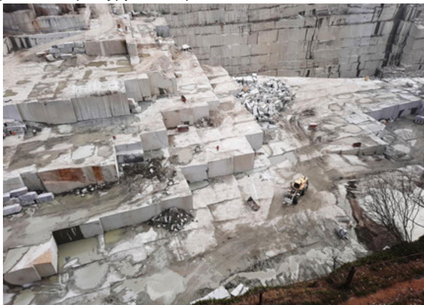
Fot. 4. Złoże granitu – Borowskie Kopalnie Granitu i Piaskowca Skalimex w Kostrzy - Fot. 1-5

Granit w rejonie Kostrzy, w zachodniej części masywu strzegomskiego, wyróżnia się bardzo dobrą blocznością. Udokumentowanych jest tu kilka sąsiadujących ze sobą złóż.