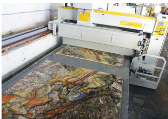
Linia szlifierska do polerowania płyt kamiennych