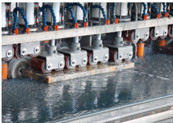
Boczkarka do polerowania boków, kalibrowania i nacinania kapiosów w parapetach