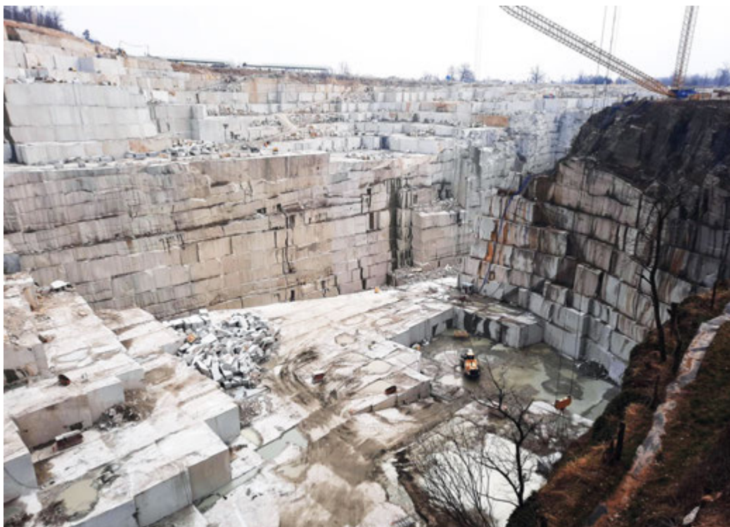
Fot 2. Złoże granitu – Borowskie Kopalnie Granitu i Piaskowca Skalimex w Kostrzy - Fot. 1-5

W strefie brzeżnej masywu, zwłaszcza w rejonie Strzeblowa, granit jest przeobrażony w bezłyżczykowy leukogranit wykorzystywany jako surowiec skaleniowy. W niektórych obszarach popularne są w granicie żyły i gniazda pegmatytowe z dobrze wykształconymi dużymi kryształami kwarcu, skaleni i innych minerałów wykorzystywane do celów kolekcjonerskich.