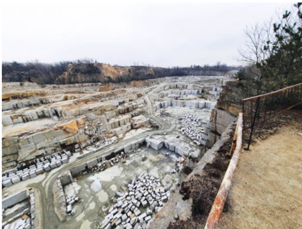
Fot 1. Złoże granitu – Borowskie Kopalnie Granitu i Piaskowca Skalimex w Kostrzy - Fot. 1-5

Granit masywu strzegomskiego jest szary średnioziarnisty biotytowy i dwułyżczykowy, o zróżnicowanych cechach petrograficznych. W zależności od nich wyróżnia się szereg jego odmian: