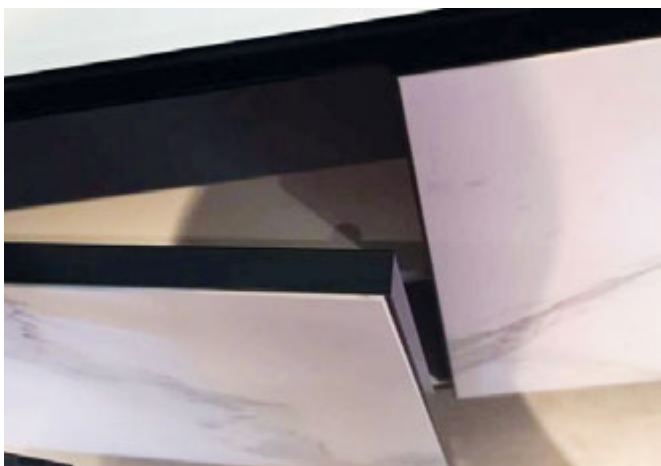
Bardzo cienkie płyty kamienne