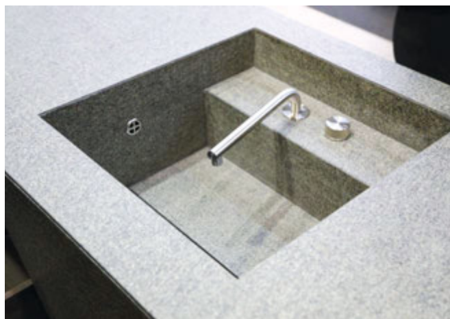
Zlew wykonany z cienkich płyt