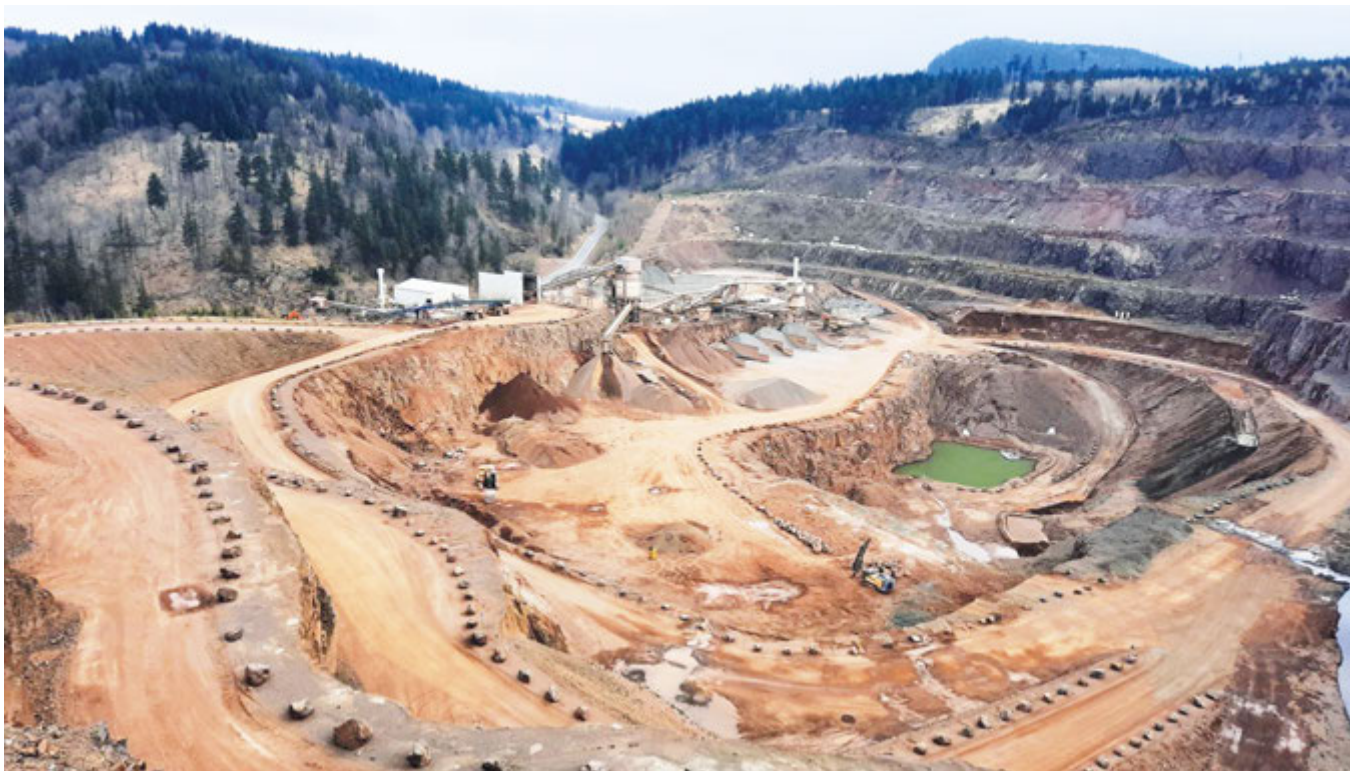
Fot. 3. Złoże trachyandezytu - Kopalnia Melafiru „Rybница Leśna” – Fot. 1 - 3

Złoże eksploatowane jest przez Kopalnię Surowców Skalnych w Bartnicy Fot. 1-3). Udostępnione jest na 10 poziomach w wyrobisku stokowo-wgłębnym. Eksploatowane jest systemem ścianowym z równoległym postępowaniem frontów. Wydobywany melafir wykorzystywany jest do produkcji kruszyw drogowych i kolejowych.