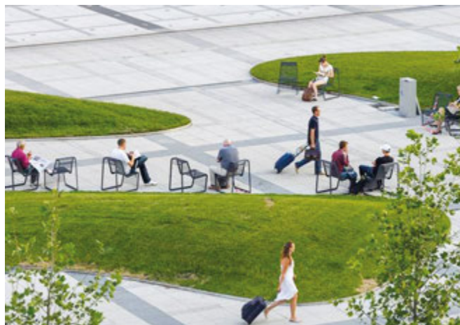
Przykłady wykorzystania materiałów kamiennych przy budowie ciągów pieszych