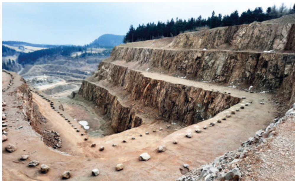
Fot. 2. Złoże trachyandezytu - Kopalnia Melafiru „Rybnica Leśna” – Fot. 1 - 3

Budujące złoże melafiry są masywne, zbite, o strukturze mikrokrystalicznej, afirowej, szare do ciemnoszarych niekiedy z odcieniem zielonkawym i jasnobrunatne do czerwobrunatnych blisko powierzchni w strefie wietrzeniowej zabarwione przez uwodnione tlenki żelaza. Podstawowym składnikiem skały są plagioklasy (andezyn –labrador), którym towarzyszą piroksen, tlenki Fe i Ti oraz kwarc, albit, ortoklaz, kalcyt.