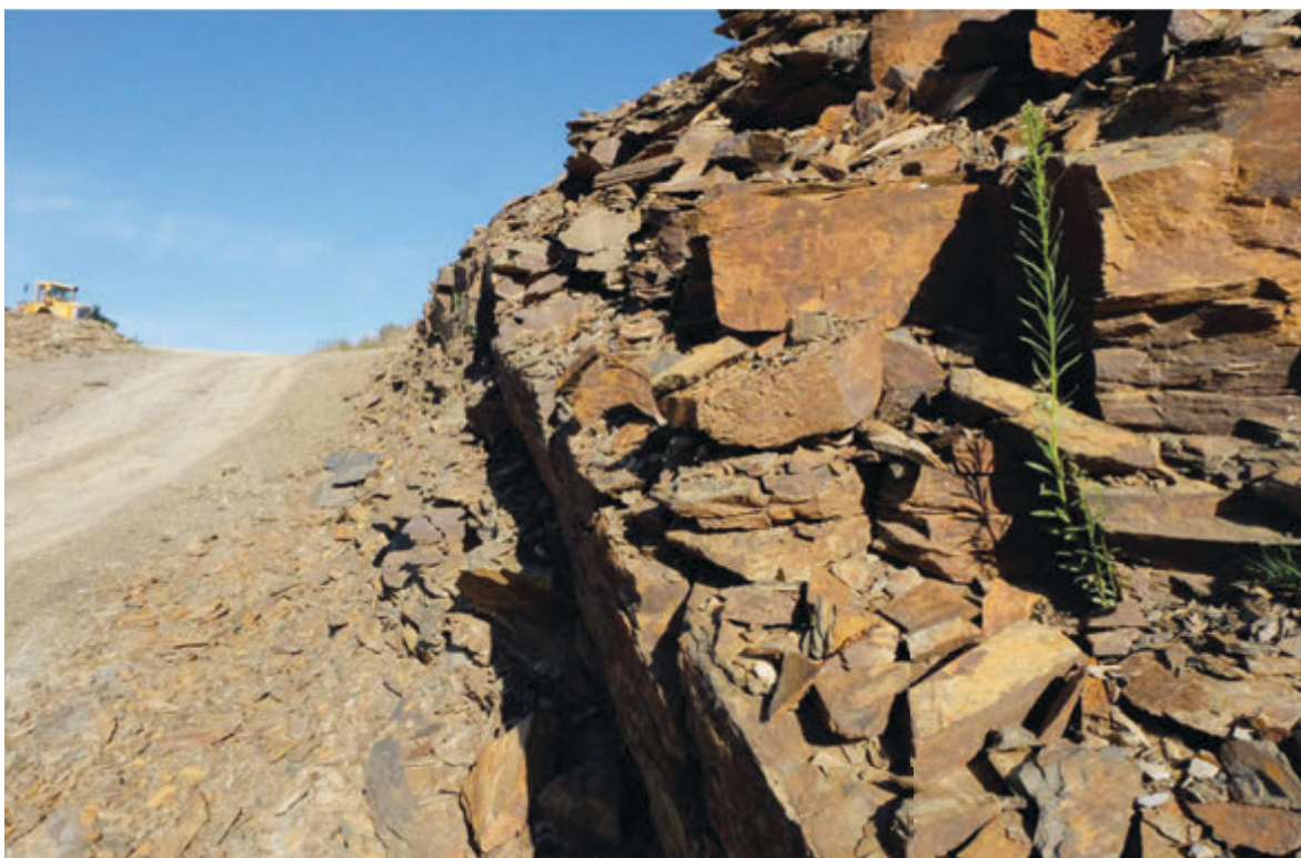
Fot. 2. Złoże łupków – Kopalnia Łupka Szarogłazowego w Jenkowie – Fot. 1 - 4

Wykorzystanie łupków szarogłazowych datuje się, co najmniej od XVI wieku, w budownictwie sakralnym oraz jako materiał budowlany przy wznoszeniu domów i zabudowań gospodarczych. Eksploatacja na te potrzeby była prowadzona okresowo w wielu miejscach.