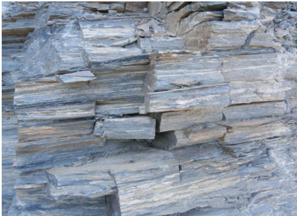
Fot. 3. Złoże łupków – Kopalnia Łupka Szarogłazowego w Jenkowie – Fot. 1 - 4

Łupki szarogłazowe wyróżniają się szarą lub oliwkowoszarą barwą. Na powierzchniach zwietrzałych są żółtordzawe lub brunatnawe. Mają zmienne uziarnienie od równoziarnistego do nierównoziarnistego i zmienny stopień podzielności łupkowej. Pojawiają się tu fragmenty bardziej masywne lub bardziej łupkowe. Gęste spękania powodują ich podzielność płytkową. Ich skład mineralny jest prosty: dominują kwarc, albit, serycyt, w towarzystwie muskowitu, biotyty i chlorytu oraz tlenków żelaza.