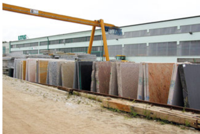
Skład importowanych płyt z kamienia naturalnego