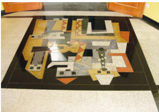
Kopia obrazu Picassa wykonana z odpadów z płyt kolorowych