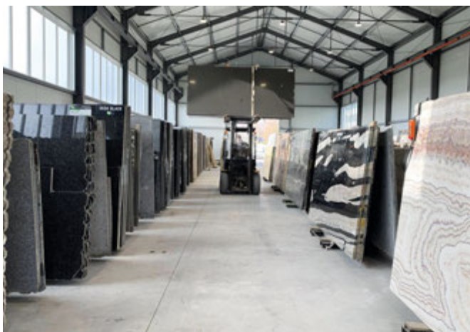
Skład importowanych z całego świata płyt kamiennych