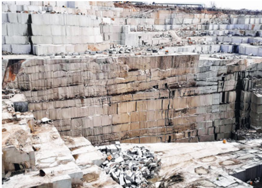
Fot 3. Złoże granitu – Borowskie Kopalnie Granitu i Piaskowca Skalimex w Kostrzy - Fot. 1-5

Granit strzegomski wykorzystywany jest od czasów przedchrześcijańskich (do wykonywania rzeźb kultowych, kamieni żarnowych). Na dużą skalę prowadzona jest jego eksploatacja, co najmniej od XVII w. Występujący w granicie system spękań (ciosu): pionowych podłużnych i poprzecznych oraz poziomych (pokładowych) umożliwia pozyskiwanie dużych foremnych bloków stosowanych w budownictwie inżynierskim (mosty, nabrzeża portowe itp.), do budowy pomników oraz do produkcji płyt okładzinowych, chodnikowych, (surowych, polerowanych, groszkowanych, płomieniowanych), oraz formatowanych elementów kamiennych (np. wałów do pras papierniczych). Odmiany średniokrystaliczne mają, po wypolerowaniu, cechy dekoracyjne.