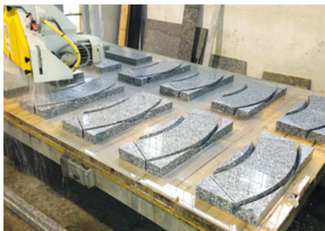
Cyrkularka CNC do wycinania skomplikowanych elementów

Firma Litos oferuje różnorakie produkty m.in. blaty kuchenne, bonie, elementy łupane i małej architektury, fontanny, graniczniki i słupki poligonalne, kostki surowo łupaną oraz z płyty, krawężniki i oporniki. W szerokiej ofercie firmy nie brakuje również kwietników, ławek ogrodowych, parapetów, płytek i płyt elewacyjnych i posadzkowe, czy płyt surowych i polerowanych, słupów ogrodzeniowych, stopni blokowych oraz okładzinowych. W ostatnim czasie, nowością w imponującym wachlarzu artykułów są super cienkie płyty z kamienia naturalnego.