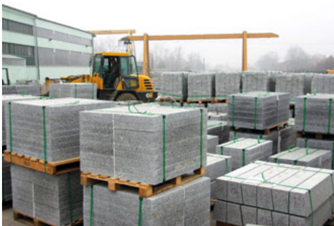
Gotowe wyroby z granitu strzegomskiego przygotowane do wysyłki

Litos Sp. z o.o. rozpoczęła działalność na rynku polskim w 1997 roku. Doświadczenie nabyte w ciągu tych lat pozwala firmie plasować się na wysokiej pozycji wśród liderów zajmujących się handlem oraz produkcją wyrobów z kamienia naturalnego. Nowoczesny park maszynowy oraz wykwalifikowana załoga może sprostać oczekiwaniom klientów realizując zamówienia w szybkim czasie oraz z najwyższą dbałością o jakość produktów. Katalog materiałów firmy obejmuje szeroką gamę różnego rodzaju kamieni naturalnych o bardzo bogatej gamie kolorystycznej. Pochodzą one praktycznie z całego świata (m.in. z Polski, Ukrainy, Skandynawii, Afryki Południowej czy Indii).