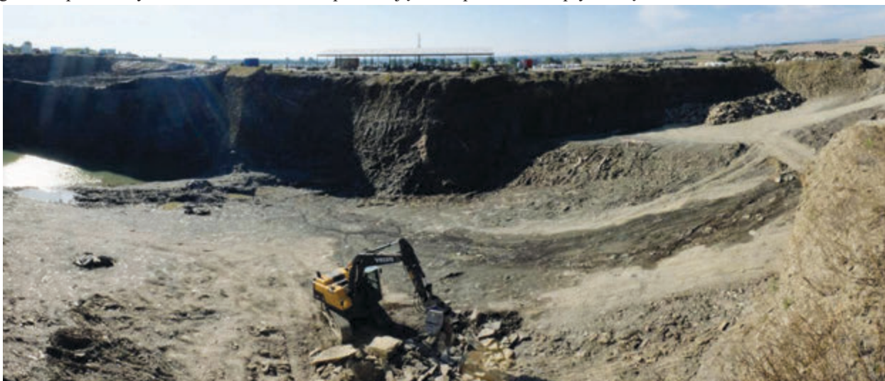
Fot. 1. Złoże łupków – Kopalnia Łupka Szarogłazowego w Jenkowie – Fot. 1-4

Złoże łupków szarogłazowych Jenków jest unikatowym wśród złóż kwalifikowanych jako kamienie budowlane. Wyróżnia się szczególnymi walorami wizualnymi i właściwościami pozyskiwanego surowca kwalifikującego się do produkcji drobnych elementów kamiennych, w szczególności dekoracyjnych o szerokim zastosowaniu. Złoże znajduje się na obszarze zachodniej części bloku przedsudeckiego, w granicach kaczawskiego łupkowo-zieleńcowego pasma fałdowego, na północ od strzegomskiego masywu granitowego. Zlokalizowane jest na obszarze występowania słabo zmetamorfizowanych utworów piaszczystomułkowych (fliszowych), które odsłaniają się w izolowanych obszarach między Wądrożem Wielkim, Goczałkowem a Udaniem wyniesionych spod przykrycia utworów neogenu i czwartorzędu. Wiek utworów budujących złoże nie jest dokładnie określony. Uważa się, że powstały one w czasie od dewonu do wczesnego karbonu i zostały zmetamorfizowane i tektonicznie zdeformowane w okresie orogenezy waryscyjskiej. Pojawiła się wówczas ich foliacja niezgodna z pierwotnym ich uwarstwieniem i powodująca ich podzielną płytkową.