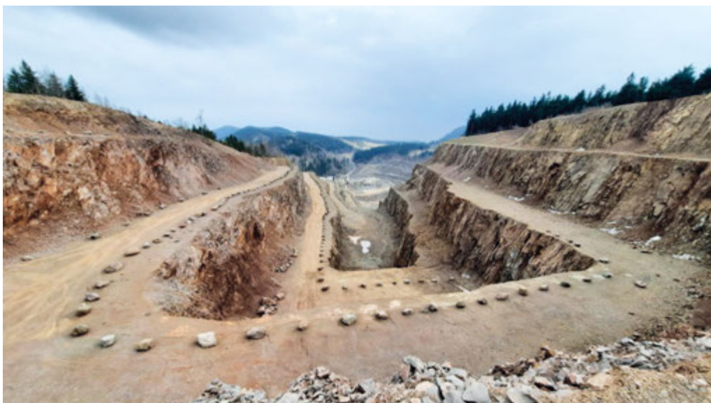
Fot. 1. Złoże trachyandezytu - Kopalnia Melafiru „Rybnica Leśna” – Fot. 1 - 3

Złoże melafiru Rybnica Leśna położone jest w środkowej części Gór Suchych w obrębie masywu Gór Kamiennych. Zajmuje wschodnią i szczytową część góry Bukowiec (894 m n.p.m.). Początkowo uważano, że obejmuje ono fragment pokrywy lawowej o miąższości ok. 150 m. Nowsze badania sugerują, że jest to intruzja śródwarstwowa (sil) w obrębie ilasto piaszczystej serii osadów permu.